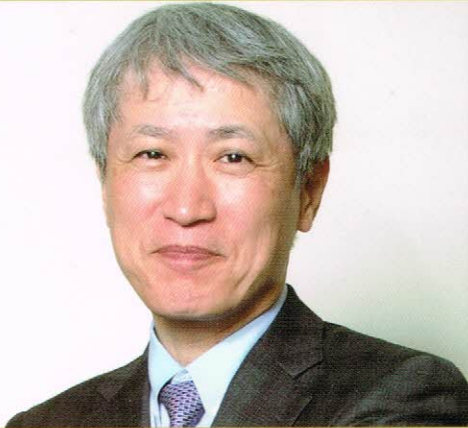
順天堂大学医学部附属 順天堂医院 院長