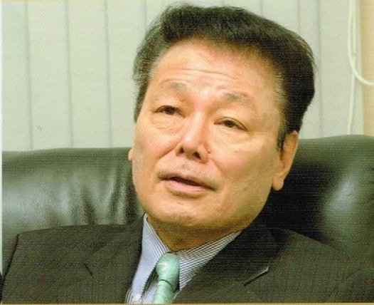
デューク大学脳神経外科教授