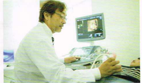
最新の医療機器を使用し、院長と優秀なスタッフが女性特有の体の異変に素早く対応します。